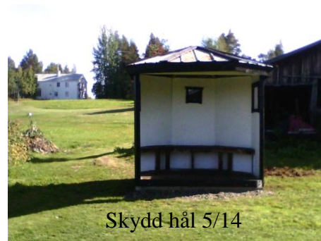
Skydd hål 5/14

Alla hål har nu tre utslagsplatser med slopning 2014. Det har gett möjlighet till en 18 håls slinga med varierande tee. Spelordningen på banorna har lagts om så att det blir bättre fördelning mellan par 3 och par 4 hålen. Bunker på hål 9 har byggts om för att sätta den mer i spel och har fått högre kant mot green 9. Säkerheten har förbättrats med fler skyddsnet och fast skydd med tak hål 5/14.